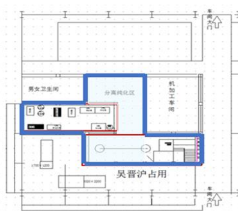
图 2 一层地面施工区域